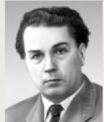
Майборода Георгій Іларіонович

Де змальовується мальовничу панорама Карпат із 4-х контрастових картин (романтично гірський пейзаж, скорботний спомин, звитяжний герць плотогонів із бурхливою річкою, та запальний гуцульський танок) проймає тріумфальна заклична емблема-лейтобраз, що динамізує і об'єднує композицію. Рапсодія належала до репертуару творів, що свого часу презентували українську музику. Під час прослуховування «Гуцульської рапсодії» у виконанні Петра Тереплюка, я зрозуміла, що вона цілісно передасть всю атмосферу Карпат, та дух і красу гуцульського життя через її мелодію.